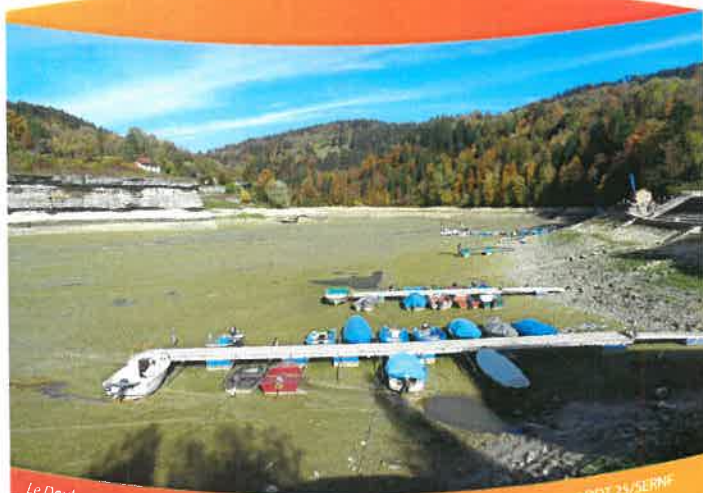
Le Doubs à Villers le Lac (10/2018)

Économiser l'eau, c'est protéger la ressource mais c'est aussi réduire ses dépenses