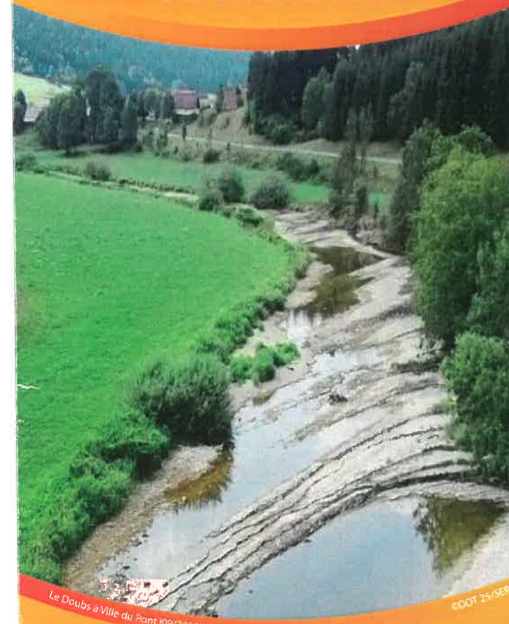
Le Doubs à Ville du Pont (09/2018)