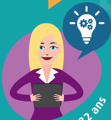
Clotilde 32 ans